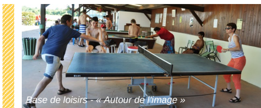
Base de loisirs - « Autour de l'image »

◦ Parcours de mini-golf La réservation se fait à l'accueil de la piscine. Tarif : 2,50 € /pers. Gratuit pour les - de 6 ans.