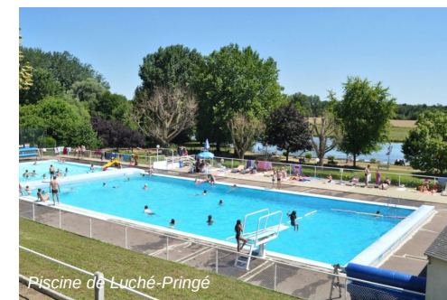
Piscine de Luché-Pringé